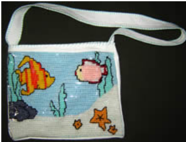
Acessório com Tapeçaria

Sex, 20 de Outubro de 2006 19:48 - Última atualização Ter, 21 de Julho de 2009 22:05